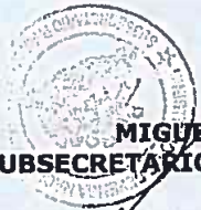
MIGUEL ÁNGEL SCHUDA GODOY SUBSECRETARIO PARA LAS FUERZAS ARMADAS (S)